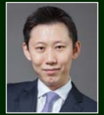
D. Young Park