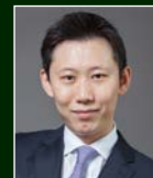
D. Young Park