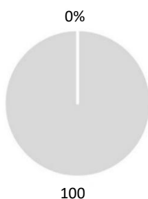
2. Allineamento degli investimenti alla tassonomia escluse le obbligazioni sovrane*